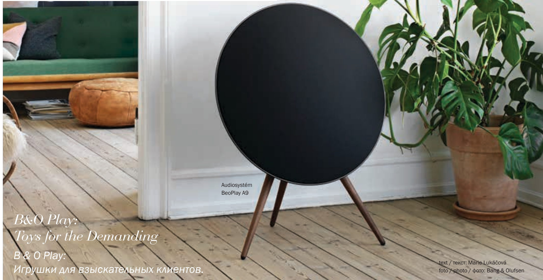
Audiosystém BeoPlay A9