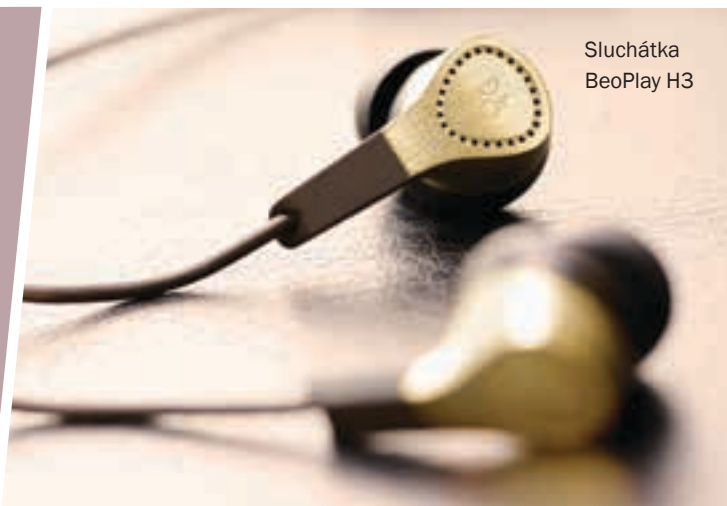
Sluchátka BeoPlay H3