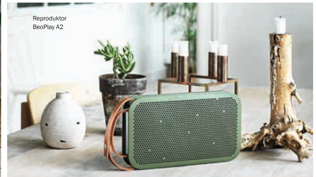
Reproduktor BeoPlay A2

B&O Play je mladším sourozencem proslavené dánské značky Bang & Olufsen. A jako většina mladších sourozenců plně využívá toho, co může od svého staršího bratra pochytit. Čerpá tedy z téměř devadesátileté historie společnosti, která se stala průkopníkem v oblasti elektronického designu a technologických inovací. Přesto nikdy nesklouzla jen k líbivosti, ale její estetika jde ruku v ruce s funkcí.