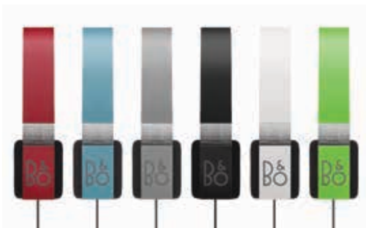
Sluchátka Form 2i

Výrobky značky B&O Play si můžete přijít vybrat do prodejny Bang & Olufsen v Jáchymově ulici v Praze 1.