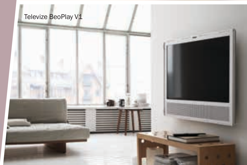
Televize BeoPlay V1

Blíží se Vánoce, čas dárků, a tak máme pro vás tip: novinku, přenosný reproduktor BeoPlay A2. Je jednoduše krásný a také úžasně praktický. Je vybavený koženým popruhem, funguje s Bluetooth technologií a bez připojení k internetu, jen ho spárujete s mobilním přístrojem a vmžiku jste připraveni pustit si hudbu. Baterie má výdrž 24 hodin. A pozor! Nehraje jen „dopředu“, ale má rozsah 360°.