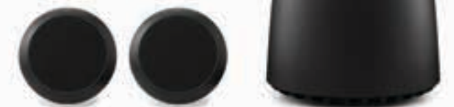
Audiosystém BeoPlay S8